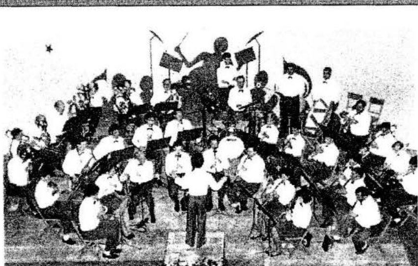
Il Complesso Bandistico Venzone durante Concerto di Ferragosto 1991