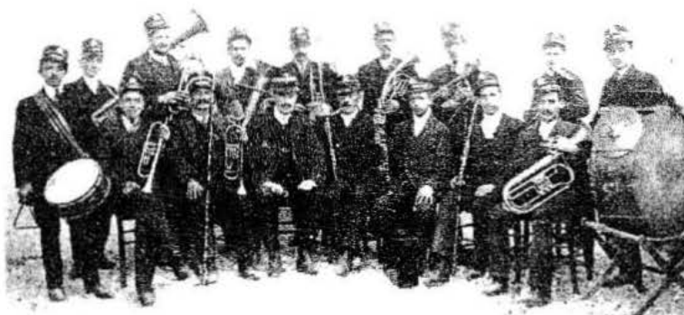
La Banda musicale di Venzone in una rara fotografia di inizio secolo