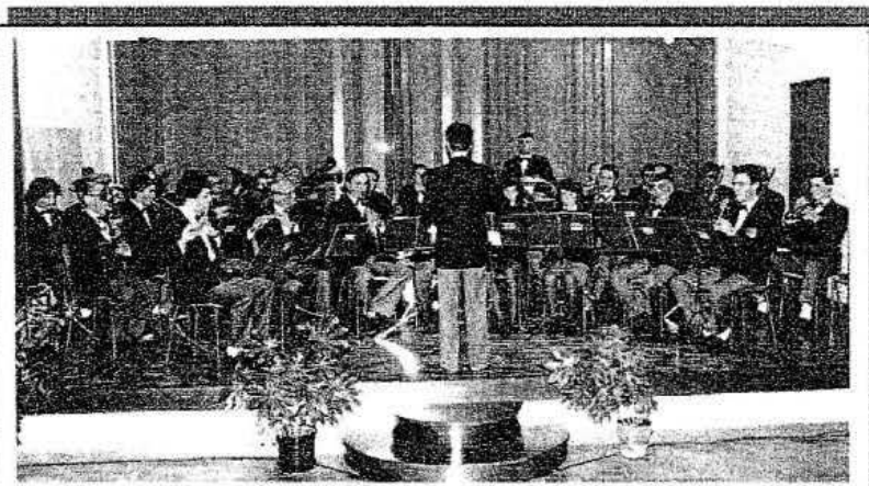
Il Complesso Bandistico durante un concerto presso l'Auditorium della Scuola Media di Venzone

La novità di quest'anno è stata la realizzazione del calendario per l'anno 2000 che riporta una bella foto del Complesso Bandistico ed una frase augurale: "Anin indevant insieme...". Fra i prossimi importanti impegni c'è una manifestazione con la partecipazione di tre Bande musicali e il Gemellaggio con la Filarmonica di Piobesi che, programmato per lo scorso anno, era stato sospeso in segno di lutto.