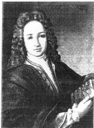
Un ritratto giovanile di Haendel

Nel 1710 viene nominato maestro di cappella ad Hannover ma, recatosi a Londra per la rappresentazione di una sua nuova opera seria, Rinaldo , decide di fermarsi stabilmente