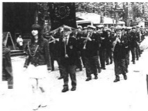
In Slovenia per il Gemellaggio tra Bled, Klagenfurt e Gemona del Friuli

La banda musicale è un gruppo spontaneo che vive grazie alla passione e all'impegno dei suoi componenti. Suonare in banda infatti non è solo divertimento e allegria, ma comporta rinunce e sacri-