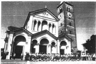
Il Gemellaggio con la Filarmonica Piobesina: uno degli avvenimenti più importanti del nostro Complesso Bandistico

PERCHÉ OGNUNO È IMPORTANTE COME MUSICISTA, MA ANCOR PIÙ COME PERSONA.