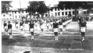
Fagagna 2012 - Raduno regionale delle Majorettes